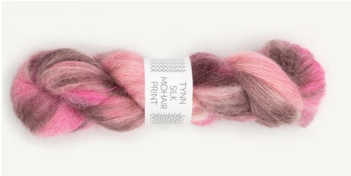
Die neue Kid Mohair Color Sandnes. 50 g, ca. 424 m, € 26,00

Das war für heute das Wichtigste. Ich wünsche eine schöne Strickzeit. Liebe Grüße